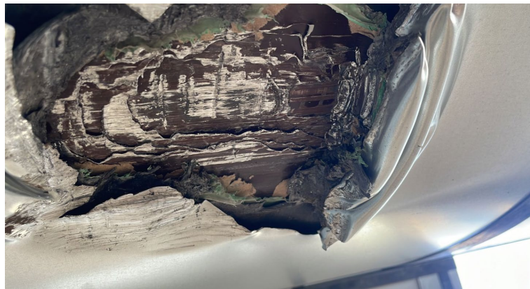
Травмирование металлопроката (рулоны)